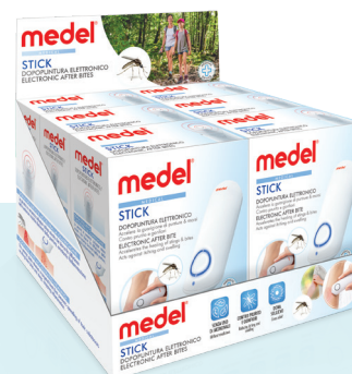
Display Box 6 pezzi